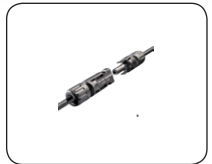
Cable connector MC4