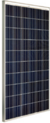
PANEL SOLAR POLICRISTALINO

Los paneles, siendo el cuerpo de cada sistema fotovoltaico, deben ceñirse a la alta demanda de durabilidad, fiabilidad y rendimiento. Los módulos fotovoltaicos de SITECNO se encuentran entre los que tienen un rendimiento más estable, por lo tanto los más rentable en el mercado.