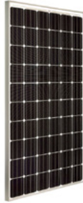
PANEL SOLAR MONOCRISTALINO